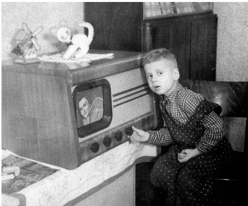
V roce 1956 byl televizor velkým zázrakem nejen pro malého kluka.