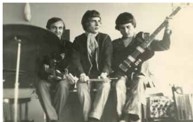
V roce 1970 byl zasažen bigbeatem. (Uprostřed formace Spektrum)