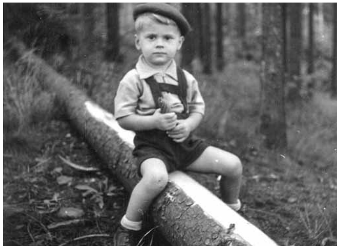
Doživotní milovník přírody

byl proveden tak, že nebylo ohroženo zdraví či život. Následně v roce 1984 odsouzen ke dvěma a půl letům nepodmíněně. Trest si odpykal v dnes již neexistující tvrdé věznici Minkovice, morálně podporován např. organizací Amnesty International. Po propuštění odsouzen ke dvěma letům ochranného dohledu. Rehabilitován byl v roce 2006.