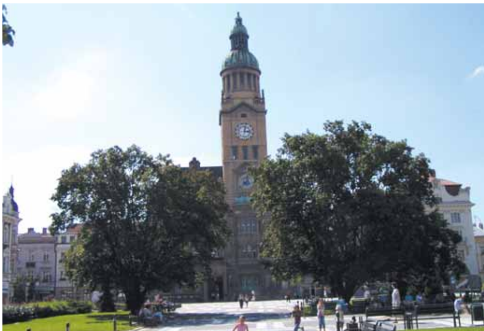
Náměstí TGM v Prostějově. Zde se budou konat předvolební diskuzní setkání s občany doplněná přitažlivým kulturním programem.

postavení či stranickou příslušnost jsem nikdy nebral ohledy, a tak se vedle starých komunistických kádrů ocitl v mých služebních hlášeních svého času i ministr spravedlnosti Jiří Novák. Důkazy,