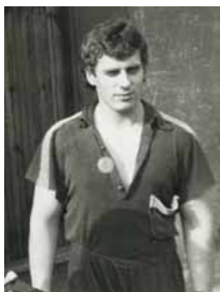
Léto 1983 - fyzicky připraven na dlouhé výslechy StB.